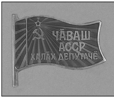
Илл. 9. Депутатский значок и удостоверение народного депутата Чувашской АССР 12-го созыва (1990–1994 гг.)