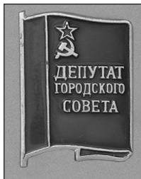
Илл. 12. Знак депутатов Чебоксарского городского Совета