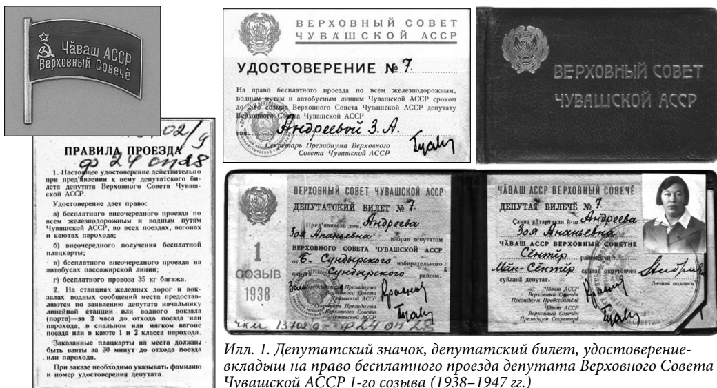
Илл. 1. Депутатский значок, депутатский билет, удостоверение-вкладыш на право бесплатного проезда депутата Верховного Совета Чувашской АССР 1-го созыва (1938–1947 гг.)