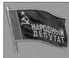
Илл. 17. Знак народных депутатов местных Советов