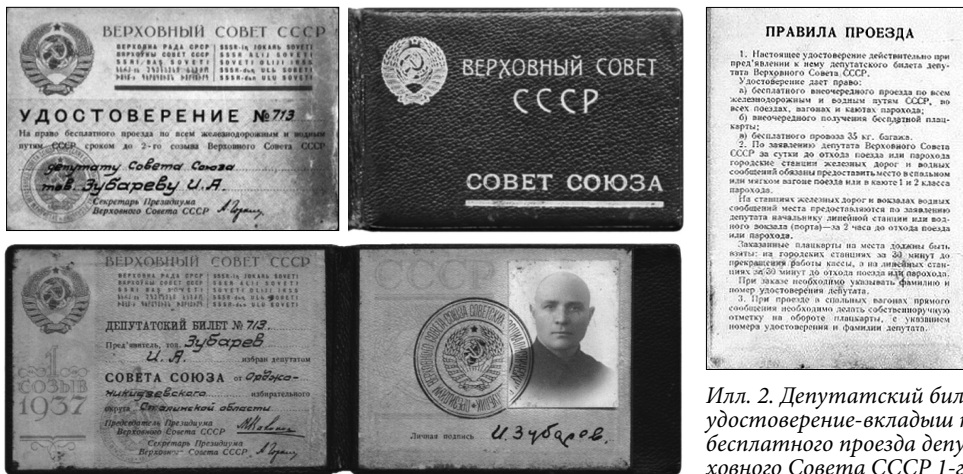
Илл. 2. Депутатский билет и удостоверение-вкладыш на право бесплатного проезда депутата Верховного Совета СССР 1-го созыва