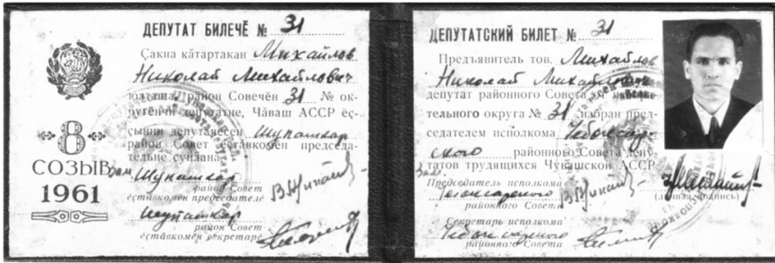
Илл. 11. Депутатские удостоверения районных Советов трудящихся и сельского депутатов Чувашской АССР