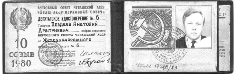
Илл. 8. Депутатское удостоверение и вкладыш к удостоверению на право бесплатного проезда депутата Верховного Совета Чувашской АССР 10-го созыва (1980–1985 гг.)