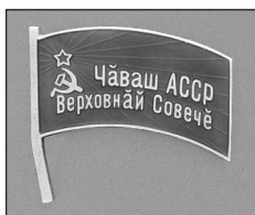
Илл. 4. Депутатский значок и депутатский билет депутата Верховного Совета Чувашской АССР 2-го созыва (1947–1951 гг.)