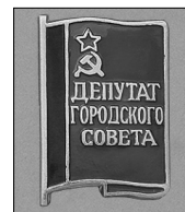
Илл. 14. Знак депутатов городских Советов республиканского значения