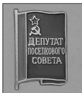
Илл. 15. Знак депутатов поселковых Советов