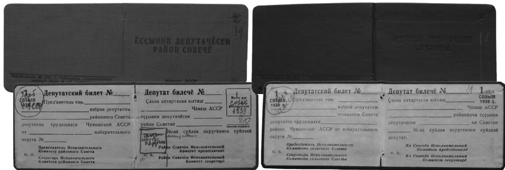
Илл. 3. Образцы депутатских билетов депутатов районного Советов депутатов трудящихся Чувашской АССР. 1939 г.