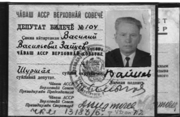
Илл. 6. Депутатский значок, депутатский билет и удостоверение-вкладыш на право бесплатного проезда депутата Верховного Совета Чувашской АССР 8-го созыва (1971–1975 гг.)