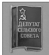
Илл. 16. Знак депутатов сельских Советов