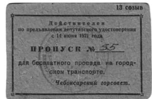
Илл. 10. Депутатские удостоверения городских Советов депутатов трудящихся Чувашской АССР и пропуск на право бесплатного проезда в городском транспорте