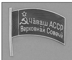
Илл. 5. Депутатский значок депутата Верховного Совета Чувашской АССР (1954–1970 гг.)