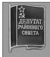
Илл. 13. Знак депутатов районных Советов