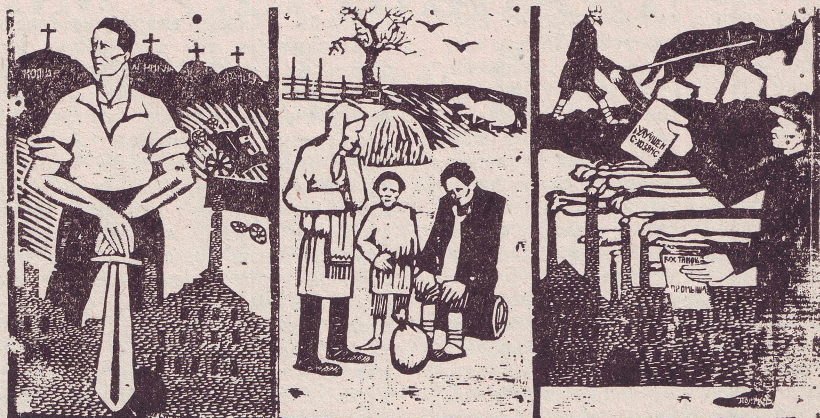
Малтанхи иерӐ юпа уйӐхӐсем.

1922 сӐлхи январь уйӐхӐ тӐлне АтӐлла Урал тӐрахӐнче 20 миллион